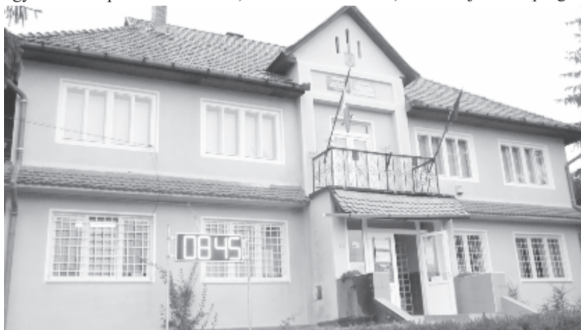
A község falvaiban térfényelő kamerákat, időjelző pannókat és új lámpatesteket szereltek fel

Az örömben üröm is keveredik azáltal, hogy első lépésben megfiúsult a magyarosiak régi vágya, a művelődési otthon korszerűsítése. Az önkormányzat félmillió euró támogatást nyert a projektre az országos vidékfejlesztési programon (PNDR), a nyertes marosvásárhelyi cég a tavaly el is kezdte a munkát, felújította a tetőzetet és néhány apróbb feladatot elvégzett, de mivel a közbeszerzési eljárás során túlságosan alálicitált az árnak, anyagi jellegű gondjai adódtak. Az önkormányzat nem volt hajlandó a saját, amúgy is szűkös költségvetéséből újabb összegeket átutalni a beruházásra, így inkább szerződést bontott, és hamarosan ismét közbeszerzést hirdet. Hogy helyesen jártak el, azt a számvevők is megerősítették – avatott be a részletekbe a község előljárója. ( gligor )